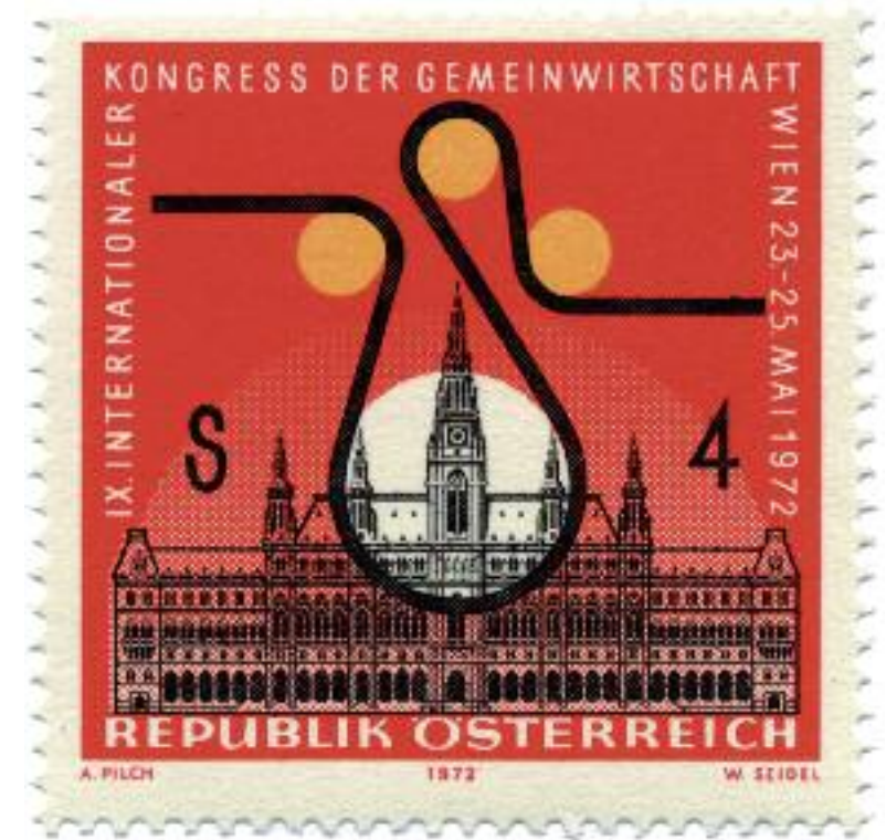
Briefmarke der Österreichischen Post zu Ehren des IX. Internationalen Kongresses der Gemeinwirtschaft im Wiener Rathaus vom 23. bis zum 25. Mai 1972

Berlin kann dazu beitragen, diese Absurditäten zu beenden. Eine Vergesellschaftung entzieht dem Finanzmarkt Kapital und bindet es lokal, nimmt also Renditedruck aus dem Markt heraus und bremst den Krisenkreislauf. Darüber hinaus wirkt sie abschreckend auf spekulative Finanzströme – Vergesellschaftung würde diese aus Berlin fernhalten. Dieser Effekt ist wünschenswert. Würden noch weitere europäische Städte Vergesellschaftung anwenden, würde sich der Renditedruck am Wohnungsmarkt insgesamt mindern. Vergesellschaftung ist somit ein Stück demokratische Deglobalisierung. Sie ist ein Gegenmodell zu protektionistischen oder nationalistischen Scheinlösungen, wie sie von rechtspopulistischen Kräften immer wieder eingebracht werden.