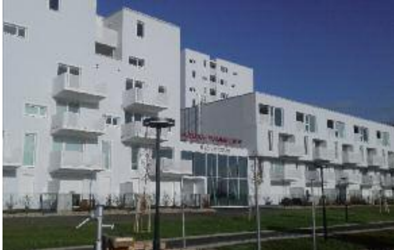
Wien zeigt, wie es geht: Die Anzahl von derzeit 220.000 Gemeindewohnungen soll erhöht werden. Im November 2019 wurde der Barbara-Prammer-Hof in Wien-Favoriten bezugsfertig. Die Bruttomiete der Ein- bis Fünfzimmerwohnungen beträgt 7,50 Euro pro Quadratmeter.