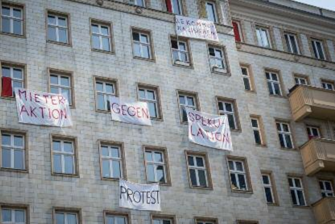
Die Berliner Karl-Marx-Allee im Frühjahr 2019