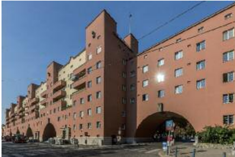
Der Karl-Marx-Hof, ein Gemeindebau im 19. Bezirk Wiens mit ursprünglich 1382 Wohnungen, wurde im Oktober 1930 bezugsfertig. Er gilt mit einer Front von einem Kilometer als der längste zusammenhängende Wohnungsbau der Welt

Finanzmärkte in die lokalen Märkte hinein. Sie sind es, die in einem zweiten Schritt Gewinne aus den Nachbarschaften durch Dividendenausschüttungen wieder in den Spekulationskreislauf einspeisen. Das Ergebnis ist nicht nur eine Umverteilung des Vermögens von lohnabhängigen Mieter*innen an die Anleger*innen und Investoren. Es entsteht auch eine wirtschaftliche Instabilität, die weit über den Berliner Wohnungsmarkt hinausreicht: Die nächste Immobilienblase wird mit der aktuellen Spekulation bereits vorbereitet.